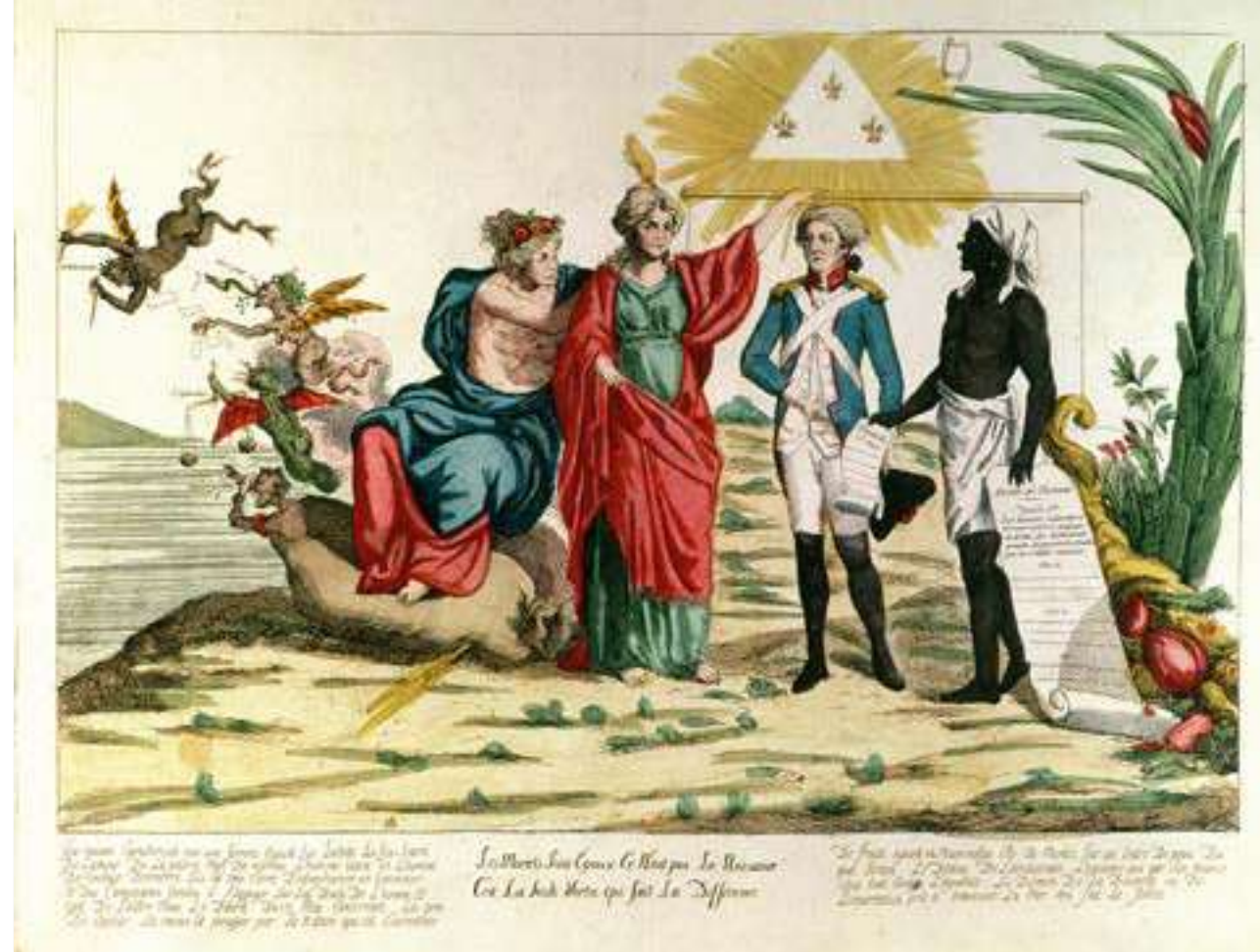
« Tous les mortels sont égaux, ce n'est pas la naissance mais la vertu qui fait la différence », allégorie (1793).

Il a fallu attendre les lendemains de la Seconde Guerre mondiale pour que la philosophie des droits de l'homme,