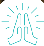
ILLUSTRATION MONUMENT DE LA RÉCONCILIATION

Seigneur, fais de nous des ouvriers de paix.