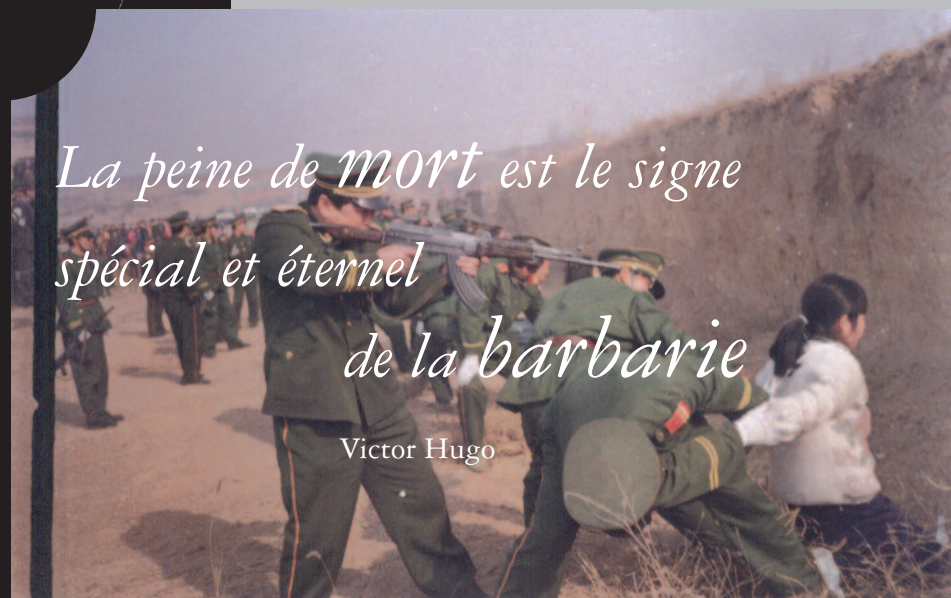
Exécution collective en Chine

La peine de mort est le signe spécial et éternel de la barbarie