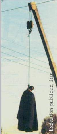
Exécution publique, Iran

Il y a cinquante ans, vingt pays avaient aboli la peine de mort. Ils sont près de cent aujourd'hui.