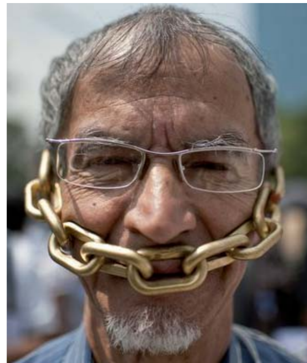
Journaliste manifestant à Mexico, le 7 août 2010

L' arraigo est un dispositif juridique qui permet d'arrêter et de maintenir en détention préventive une personne sans aucune inculpation jusqu'à 80 jours. Il s'agit d'une détention arbitraire qui viole la présomption d'innocence. Les personnes sont privées de communication avec l'extérieur, elles sont le plus souvent torturées jusqu'à ce qu'elles s'avouent coupables et/ou incriminent d'autres personnes. Les forces de police et de l'armée ont massivement recours à l' arraigo .