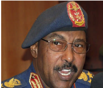
Abdelrahim Mohamed Hussein

Le Procureur de la Cour pénale internationale (CPI), Luis Moreno-Ocampo, a demandé à la Chambre préliminaire I de délivrer un mandat d'arrêt à l'encontre de l'actuel Ministre soudanais de la défense, Abdelrahim Mohamed Hussein, pour des crimes contre l'humanité et des crimes de guerre commis au Darfour d'août 2003 à mars 2004. Il s'agit de la quatrième affaire portée devant la CPI en ce qui concerne le Darfour. M. Hussein exerçait à cette époque les fonctions de ministre de l'Intérieur du Gouvernement soudanais et représentant spécial du Président au Darfour, où il jouissait des pleins pouvoirs. Les crimes qui lui sont reprochés ont été perpétrés lors d'attaques contre les villes et les villages de Kodoom, Bindisi, Mukjar et Arawala, dans les localités de Wadi Salih et de Mukjar au Darfour-Ouest, suivant un mode opératoire identique : les forces armées soudanaises encerclaient le village, l'Armée de l'air larguait des bombes sans discernement et les troupes de l'infanterie, au sein desquelles étaient incorporées les milices Janjawid, tuaient, violaient et pillaient dans le village tout entier. Ces crimes ont entraîné le déplacement de quatre millions d'habitants dont deux millions et demi demeurent à ce jour dans des camps de personnes déplacées. (Source : CPI)