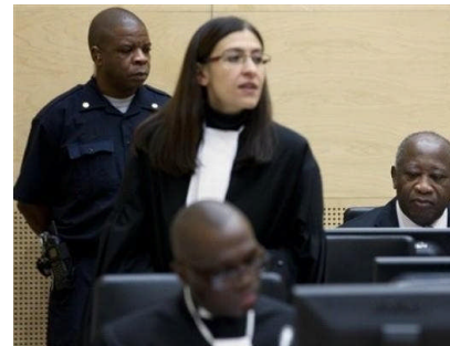
Laurent Gbagbo à la CPI

L'ex-Président ivoirien Laurent Gbagbo a été remis à la CPI, le 29 novembre 2011, par les autorités de la Côte d'Ivoire en exécution d'un mandat d'arrêt délivré sous scellés par la Chambre préliminaire III, le 23 novembre 2011, pour crimes contre l'humanité. Selon la CPI, Laurent Gbagbo aurait engagé sa responsabilité pénale individuelle, en tant que coauteur indirect, pour quatre chefs de crimes contre l'humanité à raison de meurtres, de viols et d'autres violences sexuelles,