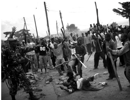
Violences postélectorales au Kenya

Quatre ans après les violences postélectorales de 2007-2008 au Kenya, la police et les institutions judiciaires du pays ont failli à leur devoir d'enquêter de manière adéquate sur les crimes commis, de juger leurs auteurs et de rendre ainsi justice aux victimes. Même si la Cour pénale internationale (CPI) s'est saisie de quelques affaires importantes, le Kenya n'a toujours pas créé, au sein de son système de justice, un mécanisme judiciaire spécial pour qu'un plus grand nombre d'auteurs de crimes répondent de leurs actes. Le gouvernement n'a également toujours pas indemnisé les victimes, à commencer par les quelque 21 victimes de tirs de la police qui ont gagné des procès civils contre le ministre de la Justice, mais à qui les dédommagements ordonnés par le tribunal n'ont pas encore été versés. Sur les quelque 1 133 homicides commis durant cette période, deux seulement ont mené à des condamnations pour meurtre. Les policiers qui ont tué au moins 405 personnes, blessé plus de 500 autres et violé des dizaines de femmes et de filles, jouissent d'une impunité totale. (Source : HRW)