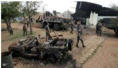
Camp militaire français de Bouaké